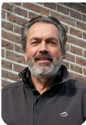
Certificeren, opleiden en toetsen

Een van de initiatieven die in 2022 is opgestart, is het oprichten van de Stichting Kenniscentrum Vertrouwenspersonen (SKV). Het algemene doel van deze stichting is het verlenen, het vergroten en toetsen van kennis en expertise van vertrouwenspersonen, die in of voor organisaties in Nederland werkzaam zijn. Dit kan in de publieke, maar ook in de private sector zijn. SKV wil door het toetsen van kennis en vaardigheden van kandidaat LVV-leden het kwaliteitsniveau van de vertrouwenspersoon verhogen en meer te uniformeren. Daarbij wil het SKV voorlichting geven over vertrouwenswerk. In 2022 zijn de eerste stappen gezet m.b.t. het opzetten en vormgeven van deze stichting. Dit krijgt in 2023 een vervolg.